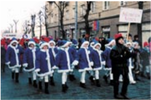
Vilnan siniset tontut.