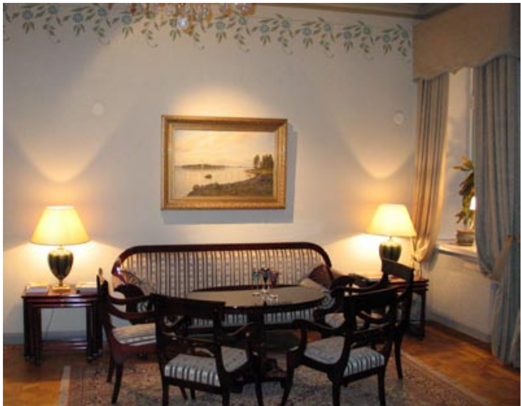
Suurlähettilään residenssi Vilnassa, keltainen salonki.

Suurimman osan ajastani ilman puolisoa Vilnassa viettäenä arvostin suuresti ja arvostan yhä niitä henkilökohtaisia ystävyys- ja tuttavuusuhteita, joita killan kautta ja muutenkin syn-