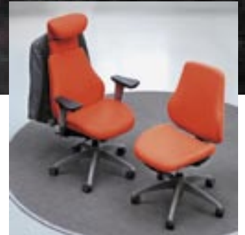
Helposti säädettävä, ergonominen työtuoli.

Toimiva, tyylikäs ja ergonominen työpiste lisää työtehoa ja viihtyvyyttä sekä ehkäisee vääristä työasennoista aiheutuvia haittoja. Työympäristön ergonomia, toimivuus, hyvä muotoilu ovat johtoajatuksiamme luodessamme uutta nykypäivän työtilatarpeisiin. Tule katsomaan ja kokeilemaan uutuuksiamme lähimpään näyttelyyn. Totea itse Iskun uusien työpisteiden toimivuus ja helppokäyttöisyys.