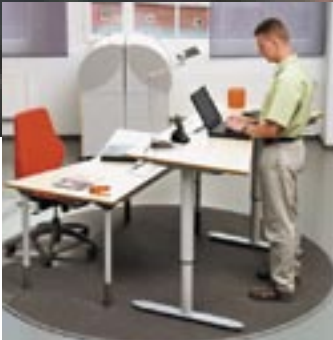
Sähköisesti korkeussäädettävä työpiste, myös seisomatyöhön.