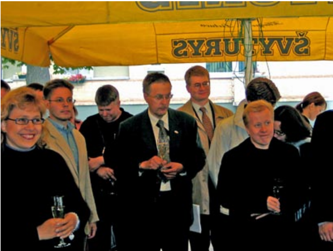
Vieraita killan kuukausikokouksessa Castradessa.

Tämä oli Liettuan uuden itsenäisyyden business historian