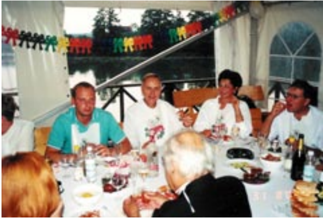
Prie Malunossa 2002.