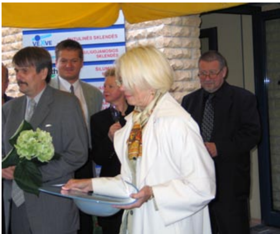
Vieraita killan kuukausikokouksessa Castradessa.

Oman yhtiöni uusi toimiala, lämpöurakointi, oli tullut tukemaan tavara kauppaamme, ja edustamamme tuotekirjo kattoi jo keskeiset alan tuotteet ja tarvikkeet. Yhtiöni palveluksessa työskenteli vuonna 2002 Vilnan ja Kaunasin konttoreissa jo 12 henkilöä. Vilnassa olimme siirtyneet omiin, uudenaikaisiin toimitiloihin paria vuotta aiemmin, ja Klaipedassa oma konttori hankittiin romanttisesta vanhasta kaupungista vuotta myöhemmin. Henkilökunnan, jota on tällä hetkellä parikymmentä, sekä asiakkaiden käyttöön ositettiin Neringan Juodkrantesta lomahuoneisto.