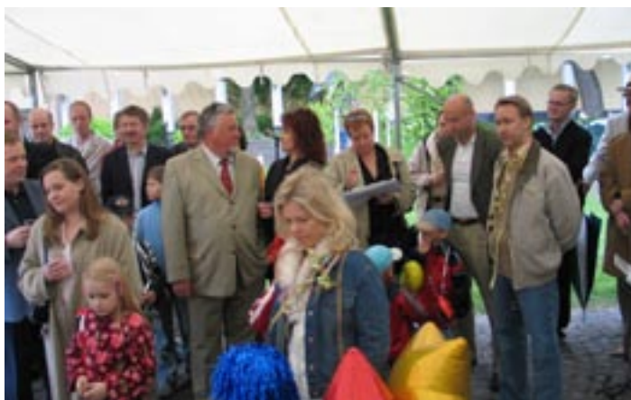
Vapun juhlijoita 2004.

Seuraava- vasta vuo- desta lähtien on waappu- juhlit kul- loistenkin suurlähettiläiden suosiollisella myötävaikutuksella pidetty Ka-