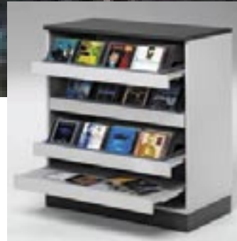
Vetohyllyt levykkeiden säilytykseen.