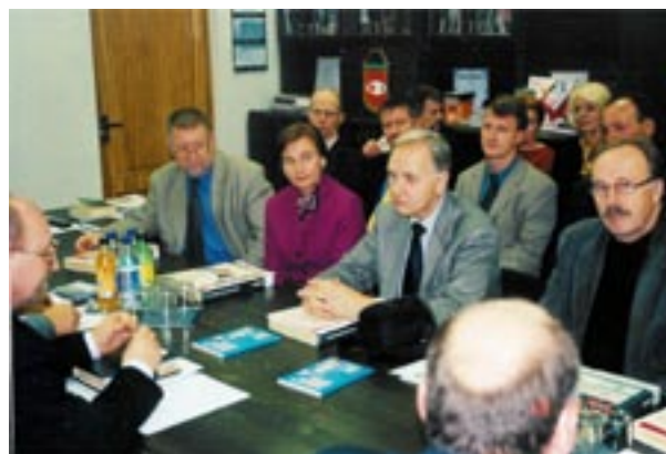
Liikemiehiä tapaamassa Minskissä syksyllä 2002.