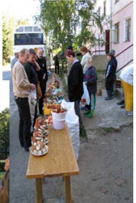
Paluumatkalla Kaliningradista sieniä ostamassa.