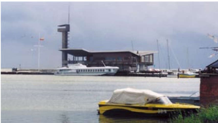
Raket Nidassa 1997. (taustalla)

vin miltei kokonaan. Ja Königstedtin loistosta on lähinnä vain muistoja jäljellä.