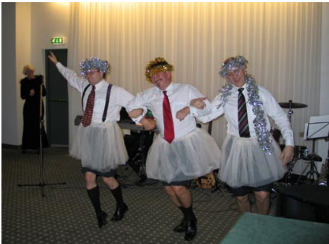
Karvaiset isot joutsenet.

Seuraavaksi suuntasimme matkamme itäisen naapurin, Valkovenäjän pääkaupunkiin Minskiin. Lukashenkan paratiisi osoittautui osallistujien mielestä mainettaan paremmaksi. Maaseutu oli siisti ja Minsk, joka ei ole mikään kovin viehättävä kaupunki, on kuitenkin ehdottomasti reissun väärtti. Pa-