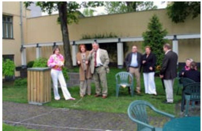
Vapun juhlijoita 2004.

Nida oli pitkään kiltan perinteinen loppukesän retkikohde. Neringan hiekkainen niemi onkin ainutlaatuisine luontoineen Liettuan ja miksei koko Euroopan hienoimpia matkakohhteita. Kiireisillä kiltalaisilla oli siellä oiva tilaisuus nauttia luonnon rauhasta ja Itämeren aaltojen kohinasta. Varsinkin silloin kun Nidaan oli tullu nopealla ja meluisalla ”Raketalla”. Laivamatka pitkin Nemunas-jokea, joka osan matkasta muodostaa Liettuan ja Kaliningradin välisen rajan, on tosin