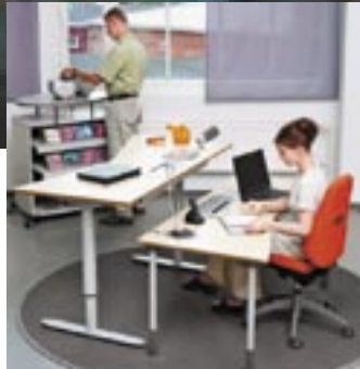
Erlaisia työpisteratkaisuja istumatyöhön.