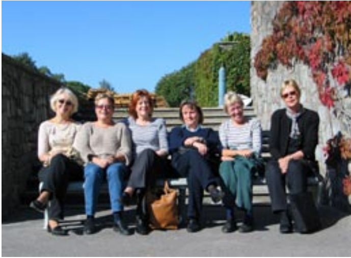
Killan tytöt Kaliningradissa hotellin edustalla.